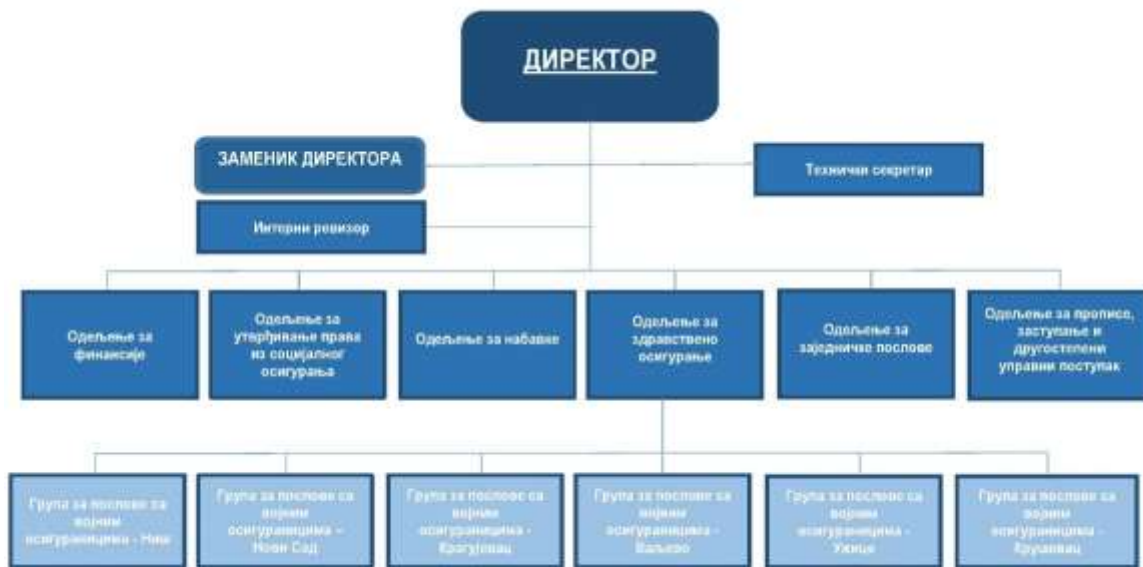
Слика број 2 : Преглед организационе структуре Фонда