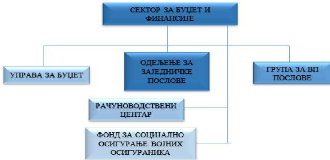
Слика број 1: Организациона структура Сектора за буџет и финансије Министарства одбране